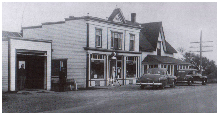
Deux photographies anciennes qui nous rappellent l'importance du commerce dans le développement socio-économique de la ville.

Les bâtiments commerciaux demeurent une dimension importante de la ville; leur présence est essentielle pour en assurer la vitalité socio-économique : maintenir la qualité de vie des résidents et répondre le plus possible à tous leurs besoins de consommation, tout en gardant localement les activités économiques.