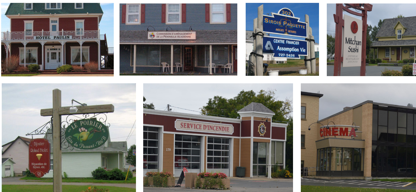
Plusieurs exemples d'enseignes commerciales bien proportionnées qui tiennent compte de l'architecture du bâtiment et illustrent différents types d'affichage.

Le message d'une bonne enseigne doit être clair, lisible, concis et cohérent; souvent une image graphique associée au texte contribue à la rendre plus efficace. Les dimensions de l'enseigne, les matériaux utilisés, et les couleurs doivent tenir compte de l'architecture du bâtiment et donner une image d'équilibre et de bon goût. La conception d'une enseigne est comme celle d'une œuvre d'art : l'écriture du texte, les couleurs et le support sur lequel elle repose, sa localisation, en font une composition attrayante qui traduit la qualité de l'entreprise. Référez-vous à la réglementation municipale pour connaître les critères particuliers applicables aux enseignes.