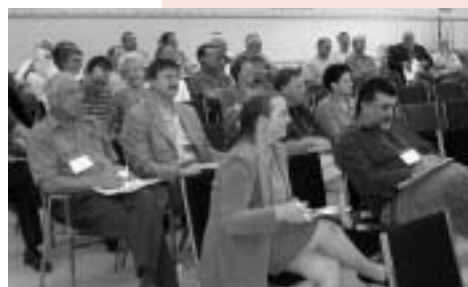
Environ 70 personnes ont assisté au colloque.

Pour atteindre nos objectifs, il est évident que la population devra nous soutenir dans cette nouvelle ère de collaboration. C'est un aspect qui ne m'inquiète aucunement