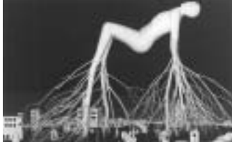
(photo : oeuvre de l'artiste Marielle Poirier - défi de création en direct 2001)

Le Festival des arts visuels en Atlantique offre chaque année une programmation innovatrice axée sur les arts visuels et sur ses créateurs. En plus des nouvelles activités à la programmation pour cette édition, les visiteurs retrouveront avec plaisir le défi de créations en direct, les espaces-ateliers, le Concours des arts visuels de la